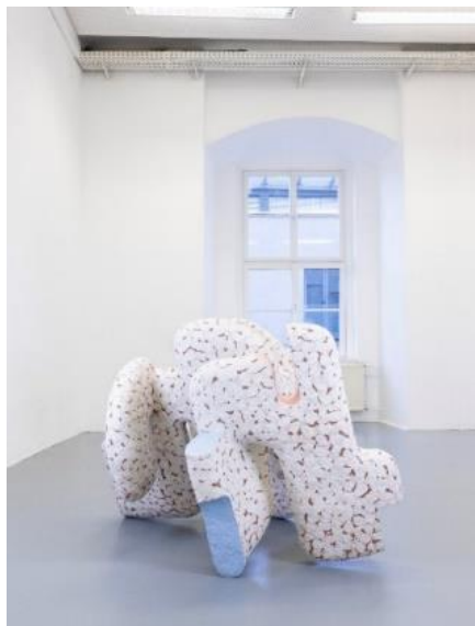
Beate Gatschelhofer: Stummes Lächeln einwärts (Debutantprisen)