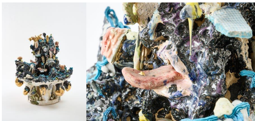
Nora Arrieta: Toteninsel